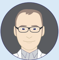
Frank Hoogstraat Produktion